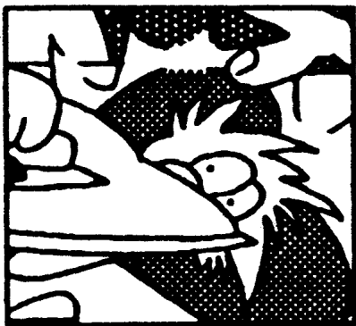
Keine Angst beim Bügeln, immer voll drüber. Dann leuchten die Farben wie am ersten Tag!