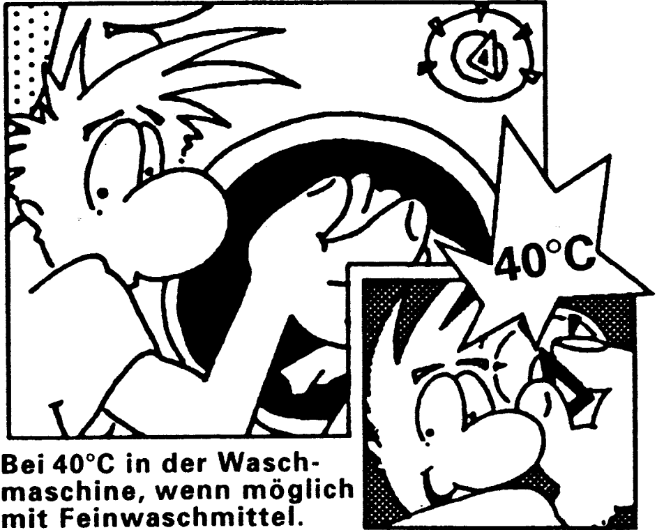
Bei 40°C in der Waschmaschine, wenn möglich mit Feinwaschmittel.